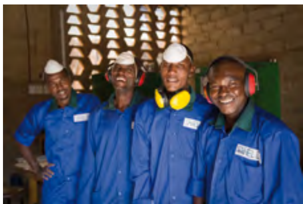
Sahel Lab, Niger

Pour soumettre une demande de financement, merci de bien vouloir contacter :