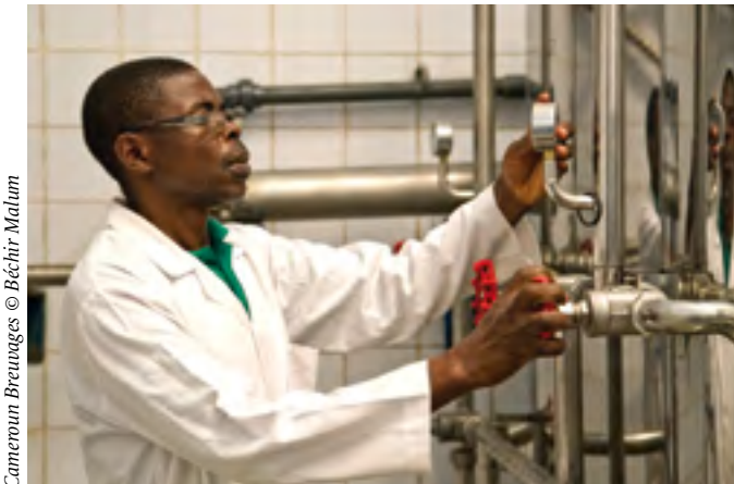
Cameroun Breuvages © Béchir Malum